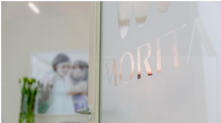
Abb. 2: Meet us @home – im Morita Showroom in Dietzenbach