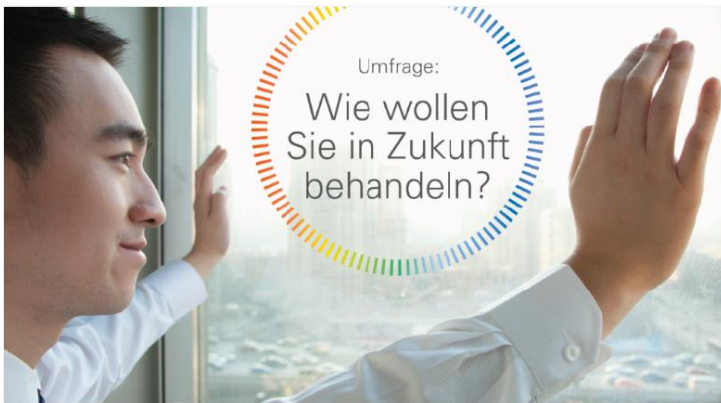
Abb. 1: Modul Morita Design Research – Online-Umfrage