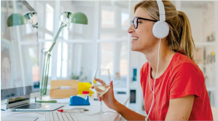
Abb. 4: Morita Talk – der digitale Austausch von Couch zu Couch