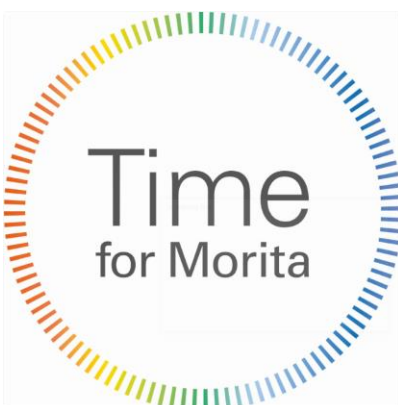
Abb. 6: Keyvisual Time for Morita